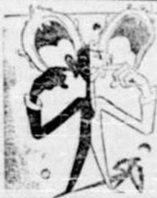
E MAI FOLOSITOR ȘI MAI DURABIL SĂ-ȚI ASUZI URECHILE LA VOIETILE VICIILOR.

Dela această dată toți contribuabilii din Municipiul Constanța vor fi urmăriți, potrivit Codului de procedură legală, cu valoarea dărilor, plus majorările legale.